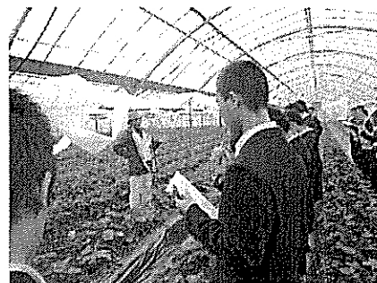
いちごハウス木場見学