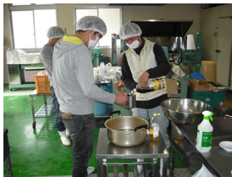
ドレッシングの調合