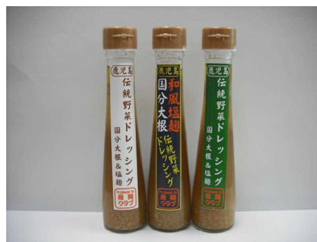
製品のできあがり